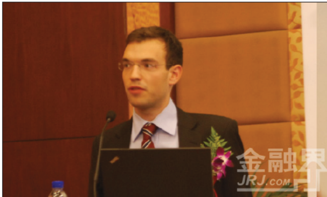
法国CARBONIUM公司的中国和东南亚地区清洁发展机制和碳交易总监

2011年06月26日 16:47 来源: 金融界网站 【字体: 大 中 小】 网友评论