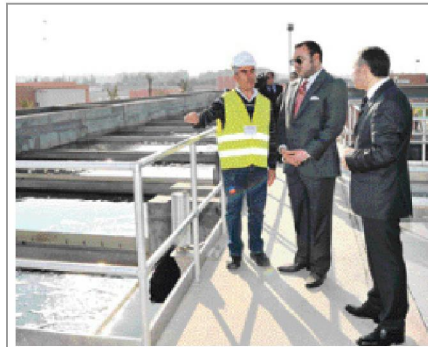
La station de traitement des eaux usées de Marrakech, inaugurée fin 2011 par le Souverain, vient d'être distinguée par les Nations Unies